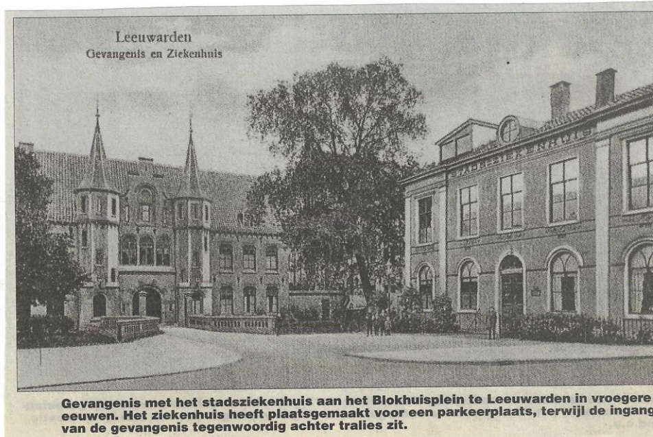
Gevangenis met het stadsziekenhuis aan het Blokhuysplein te Leeuwarden in vroegere eeuwen. Het ziekenhuis heeft plaatsgemaakt voor een parkeerplaats, terwijl de ingang van de gevangenis tegenwoordig achter tralies zit.